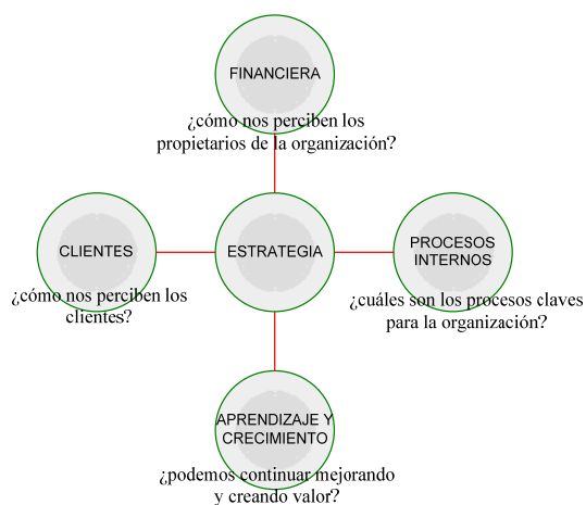
Figura 1. Perspectivas del CMI

El conjunto de indicadores que lo comprenden se clasifica en cuatro perspectivas, la financiera, la de clientes, la de procesos internos y la de aprendizaje y desarrollo, como se puede ver en la Figura 1.