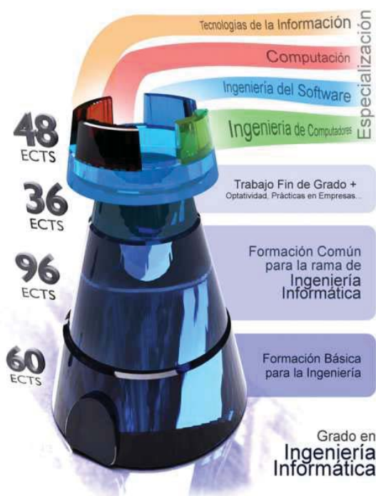
Figura 2: Estructura del Plan de Estudios de la ESI.